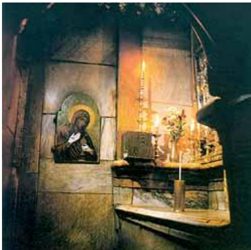
Piatra unde a stat trupul lui Hristos, din Vinerea Mare până a treia zi, acum acoperită cu marmura.

Diodorus, fost Patriarh al Ierusalimului între anii 1981 și 2000 mărturisea: "Întru în Mormant și ingenuchez cu frica Sfânta în fata locului unde a zăcut trupul lui Hristos după moarte și de unde a înviat. Rugăciunea în Sfântul Mormant este pentru mine un moment foarte Sfânt, într-un loc foarte Sfânt. De aici a înviat cu slava Domnul și de aici S-a răspândit Lumina în lume. Apostolul Ioan scrie în primul capitol al Evangheliei sale că Iisus este Lumina lumii. Ingenunchind în fata acestui loc unde El a înviat din morți, suntem aduși în imediată apropiere a Învierii Sale slavite. Catolicii și protestanții numesc biserica aceasta, Biserica Sfântului Mormant. Noi o numim Biserica Învierii. Învierea este pentru creștinii ortodocși centrul credinței. Prin Învierea Lui, Hristos a câștigat victoria finală asupra morții, nu doar asupra morții Sale ci și asupra morții celor ce sunt aproape de el. Nu cred că este o întâmplare că Focul Sfânt apare exact pe locul acesta. Matei 28:3 spune că atunci când Domnul a înviat din morți, a venit un inger îmbrăcat într-o lumină înfricoșătoare. Cred că lumina care a învaluit ingerul la învierea Domnului este aceeași cu lumina care apare miraculos în fiecare Sămbătă de Paște. Hristos vrea să ne reamintească, că Învierea Sa este o realitate nu doar un mit. El a venit cu adevărat în lume pentru a aduce sacrificiul necesar ca prin moartea și învierea Sa să se poată reuni omul cu Creatorul său".