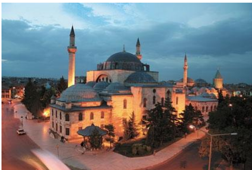
Muzeul Mevlana, complexul în care se află și mormântul lui Rumi

Ritualul, numit Sema, incepe cu o rugaciune cantata de dervisii condusi de un maestru. Samâ' (in araba: سماع , sema in turca) inseamna auditiie, dar si concert mistic, fiind legat de dansul dervisilor rotitori ("derves" se traduce sarac, cersetor in persana). Muzica este solemna, cu tonalitati stranii dar placute. Cu pasi lenti dervisii formeaza un cerc, apoi fac o serie de plecaciuni, unul catre altul si catre maestru, si ocolesc cercul de trei ori. In final, dervisii saruta mana maestrului si se avanta, pe rand, in dans. Fusta, cu deschidere ampla, se deschide si se rotește unduioș, impreuna cu dervisul. Rasucirea reprezinta si ea renuntarea la cele lumesti pentru a putea renaste intru Domnul. Dervisul isi deschide bratele si, foarte lent, ridica putin bratul drept si isi culca capul pe acel umar. Palma dreapta se desface spre cer pentru a primi binecuvantarea, iar cea stanga se intoarce spre pamant pentru a o transmite acestuia. Ritmul se inteteste, odata cu rotirea pentru a se opri apoi, brusc. Fascinatia dispare incet iar dervisii se pleaca din nou unul in fata celuilalt si parasesc, pe rand, locul unde au dansat.