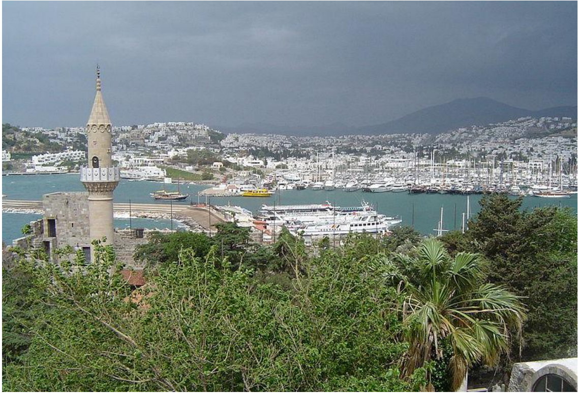
BODRUM – PORTUL